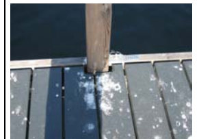
Ausschnitt für Geländerpfosten

Bachmattstrasse 53 CH-8048 Zürich TEL +41 44 436 86 86 FAX +41 44 436 86 87 info@swissfiber.com